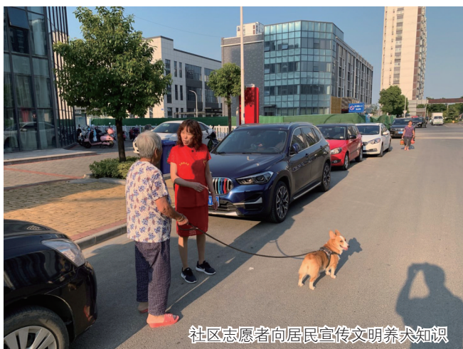
社区志愿者向居民宣传文明养犬知识

文明养犬氛围的养成,还离不开社区、物业、志愿者等群众力量的主动参与。“通过前期摸排,小区犬只量大约有60只,小区32名志愿者已经就位,他们按照错峰错时的编