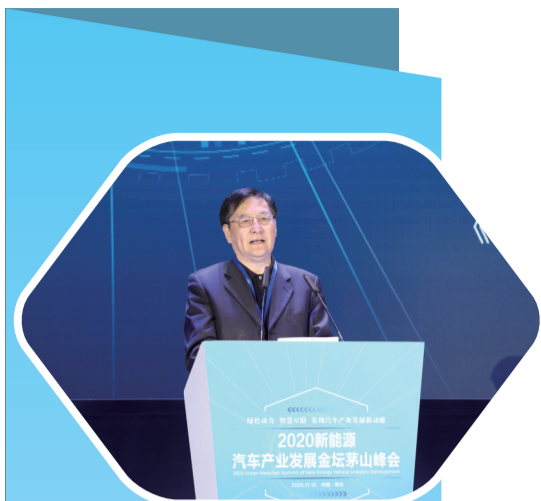
中国科技体制改革研究会理事长、科技日报社社长、国际欧亚科学院院士张景安致辞