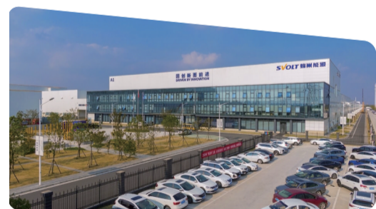
蜂巢能源科技有限公司