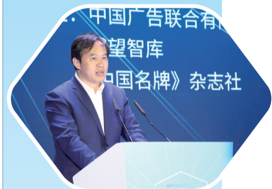
常州市副市长杭勇致辞