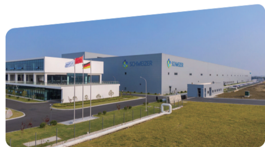
胜伟策电子(江苏)有限公司