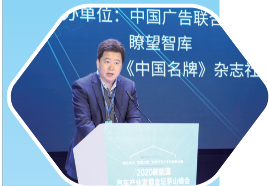
江苏省工信厅副厅长石晓鹏致辞