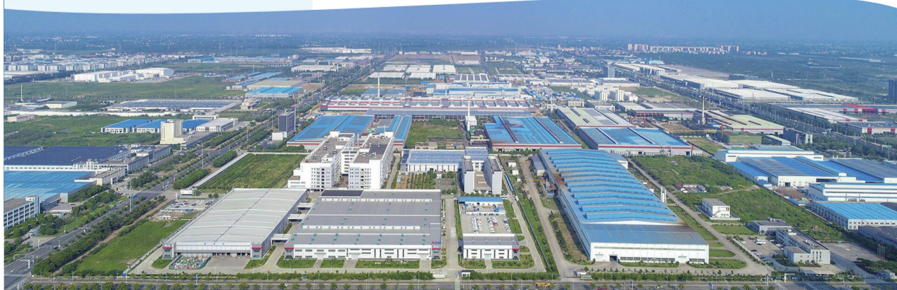
园区建设日新月异