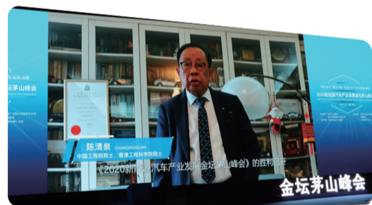
中国工程院院士、香港工程科学院院士陈清泉视频致辞