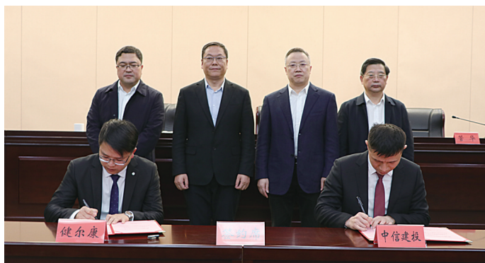
我区企业与券商代表进行签约

本报讯 昨天下午,我区召开企业股改上市推进大会,分析资本市场新形势、新机遇、新要求,通过再动员、再部署,全力推动全区企业股改上市,壮大资本市场“金坛板块”。