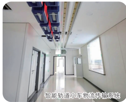
智能轨道小车物流传输系统

同时,医院还推行“互联网+医疗健康”就医模式。金坛区人民医院新医院充分体现了现代化医院的优势和特点。通过各种服务设施和先进设备,不断优化服务流程,减少患者等候时间,提供更精准诊疗服务。