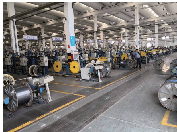
我区的江苏盈科通信科技有限公司于日前成功入围2020年江苏省工业电子商务应用示范企业拟认定名单,图为该公司生产车间。