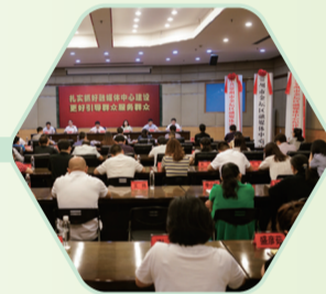
金坛区融媒体中心成立 (2020年)