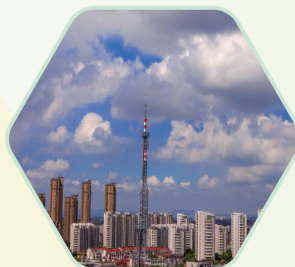
广播电视发射塔 (建于1984年)