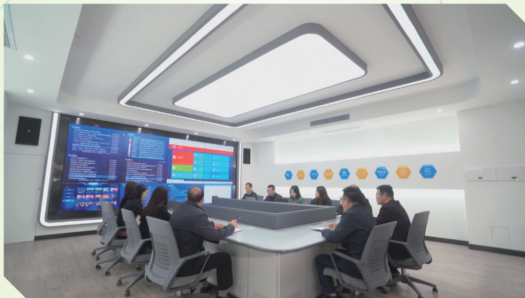
融媒体指挥中心(2020年)

往昔成旧岁,春来又新年。 2020到底有多么的难忘,2021就有多么丰富的期望。