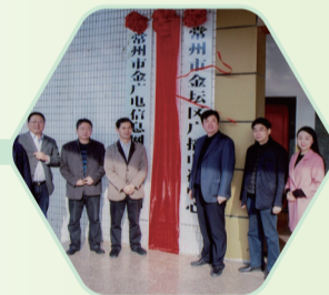
常州江东现代传媒成立 (2016年)