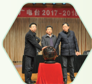
金坛手机台APP上线 (2018年)