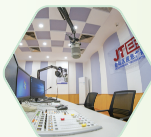
金坛区应急广播开播 (2020年)