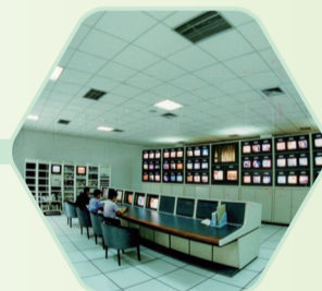
有线电视数字化整体 转换机房(2008年)