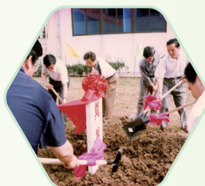
金坛广电中心改建开工 (1999年)