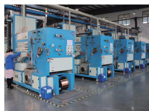
泰力松新材料焊带、漆包线项目现场