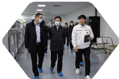
区领导督查胜伟策电子嵌入式封装电路板项目