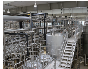
一鸣食品全产业链项目现场

岁末年初,虽已是三九时节,但在我区各板块、各园区,产业类、民生类等项目正加快建设,呈现一派热火朝天的景象。