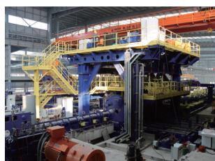
常宝普莱森特种专用管材生产线项目现场