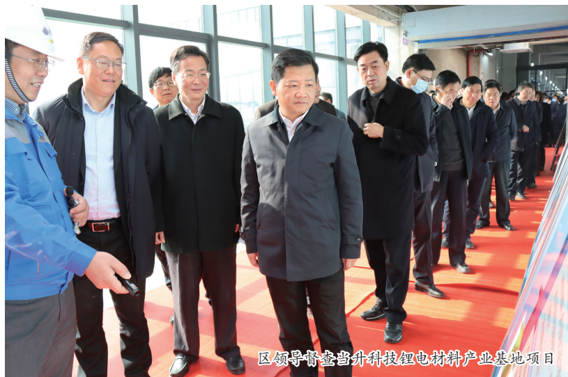
区领导督查当升科技锂电材料产业基地项目