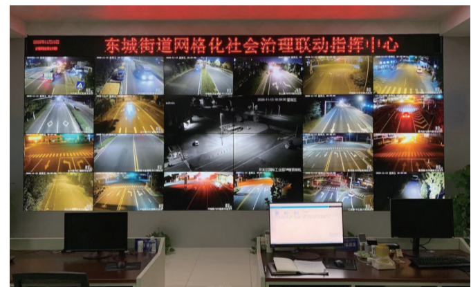
东城街道网格化社会治理联动指挥中心

城市管理落细落实。 一体化推进文明城市建设和城市长效管理。启动“十合一”专项提升行动；开展“周周查”，常态化自查自纠；发放《倡议书》3万余份，增加知晓度；社区每月轮流