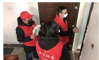
疫情防控期间，社区工作人员上门开展“十户联防、邻里守望”排查工作