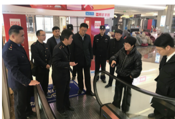
开展安全生产大排查大检查大整治行动

东城街道紧扣区委、区政府及开发区党工委、管委会决策部署，围绕街道全面决战“五个年”奋斗目标(社会治理创新年、项目保障突破年、城市管理提升年、安全生产攻坚年、体制机制优化年)，团结一心、奋勇前行，各方面工作取得了较好成效。