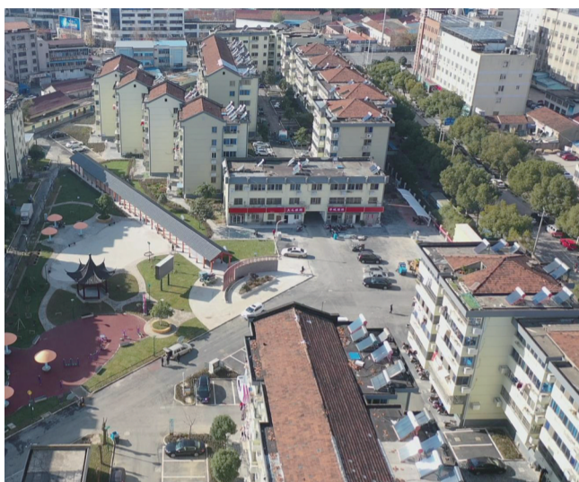
华城二村创建省级宜居示范居住区提升改造工程

举办文明主题活动累计4场，扩大影响力；开展文明城市“建言献策”和文明行为“随手拍”倡议行动，征集“金点子”63条、随手拍作品78个；举办“立足岗位展作为，助力文明新东城”青年演讲比赛，激发担当作为。