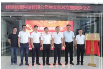
蜂巢能源科技有限公司党支部成立暨揭牌仪式