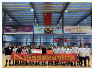
组织侨企活动爱心捐赠