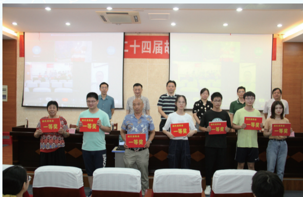
第二十四届胡氏奖助金颁奖典礼

2020年，区侨联在区委、区政府正确领导下，在上级侨联精心指导下，按照全区“两个加快全面决战年”的工作要求，克服人员少事务多的困难，围绕中心、健全机制、砥砺前行，服务地方经济社会高质量发展。