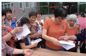
社区开展侨法宣传活动