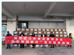
联系肯尼亚江苏商会捐赠防疫物资