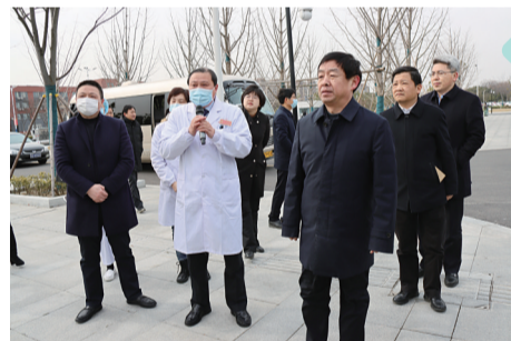
齐家滨在金坛第一人民医院调研。

项目介绍:金坛第一人民医院按照国家三级综合医院标准,分二期建设,一期建筑群有门急诊医技楼、住院楼、感染楼、培训综合楼、配套附属用房组成,目前已建成投用,每日可接待门急诊病人5000人次以上。