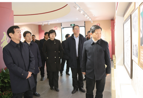
齐家滨在“映山红”党建馆调研。

项目介绍:金坛第一人民医院按照国家三级综合医院标准,分二期建设,一期建筑群有门急诊医技楼、住院楼、感染楼、培训综合楼、配套附属用房组成,目前已建成投用,每日可接待门急诊病人5000人次以上。