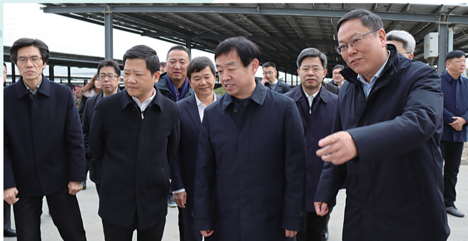
齐家滨在亿晶光电科技有限公司调研。

虽已隆冬,但金沙大地处处生机无限。昨天上午,常州市委书记齐家滨来我区调研考察,在区委书记狄志强、区长陆秋明等的陪同下,重点调研了我区“三新一特”产业发展、城市规划、生态旅游等情况,对我区以两个加快为主抓手,形成更多新的增长点、增长极,全力构筑更具竞争力影响力的新格局、新优势的做法给予肯定,要求金坛坚持稳中求进工作总基调,用好山水资源,做强现代产业,提升城市功能,打造美丽常州新样板。