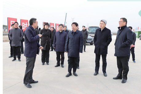
齐家滨在河海大学常州校区项目现场调研。

项目介绍:紫云湖度假酒店项目位于茅山旅游度假区内,按五星级标准打造高端度假型酒店。