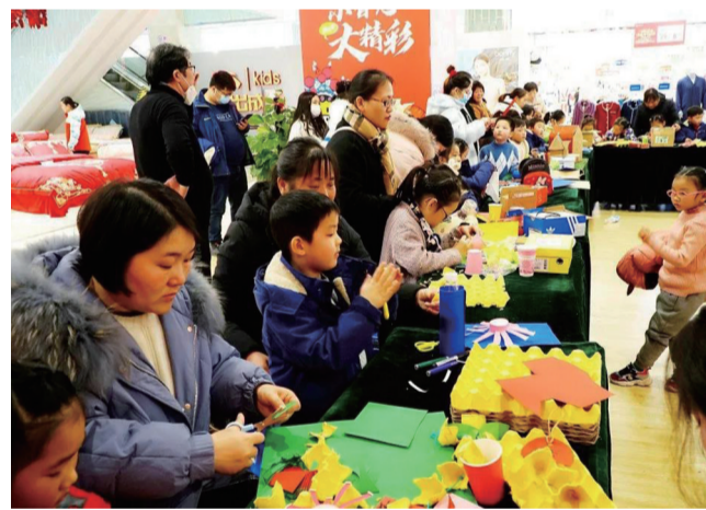
近日,我区志愿者们走进社区走上街头,用废物做礼品,做心愿盒、心愿树、心愿花,互相交换新春的第一份祝愿,表达社群邻里防控疫情,与爱同行的美好心愿。 沈灿军