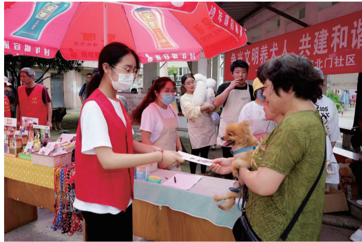
志愿者街头发放文明养犬宣传单

采访中记者了解到,部分社区仍有一些无主的流浪犬,从而产生随地大小便等一系列卫生问题。如何清理公共区域的犬粪一直是社区管理的一大难题,由于部分犬主文明意识不高,在这方面处理得还有所欠缺。对于犬粪问题,西城街道九洲里社