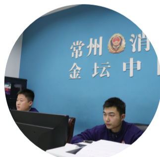
接警人员24小时值守

时值班备勤制度,每年365天,每天24小时,每分每秒都坚守在岗位上,没有上下班之分。他们时时在备战、刻刻在待命。