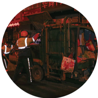
环卫工人清扫路面