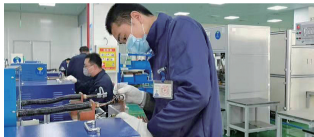
飞荣达公司积极响应“就地过年”号召

返乡。这一决定在企业内部引起了热烈反响,很多外地员工表示,隔绝疫情,不隔真情,积极响应“就地过年”的号召是做好疫情防控工作的基础,相信未来的团圆会更加温暖,他们一起留在金坛过年。