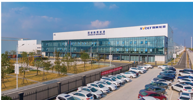
蜂巢能源推出暖心举措鼓励员工留坛