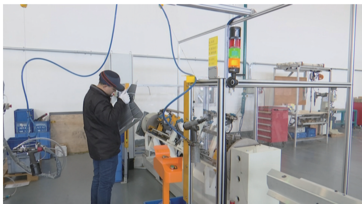
员工正在赶制生产订单

本报讯 在去年9月28日中德(常州)创新产业园开园仪式上,吉地亚汽车系统(常州)有限公司正式签约落户金坛。目前,该公司已在金坛经济开发区国际工业城内试生产。