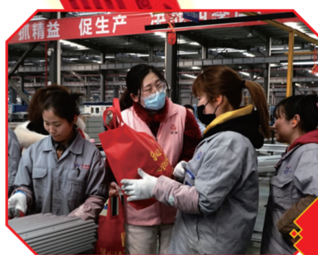
企业给留坛员工赠送大礼包