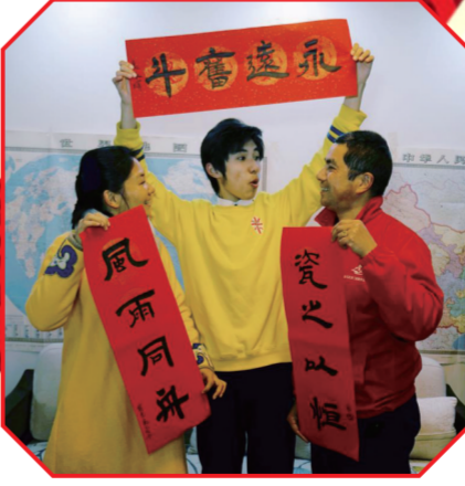
外来员工将信心和目标写进对联