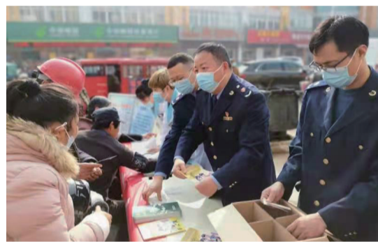
开展现场咨询活动