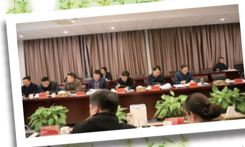
区政府研究老旧小区改造政策文件