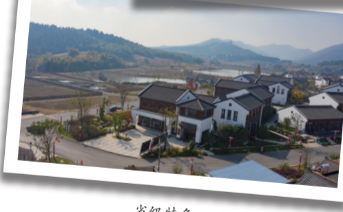
省级特色田园乡村仙姑村