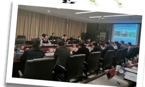
区政府主要领导听取雨污分流三年行动实施意见汇报