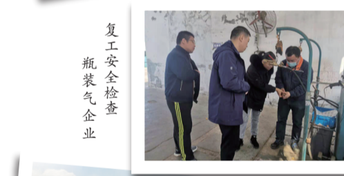
复工安全检查 瓶装气企业