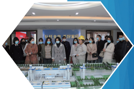
组织党员干部参观企业

器具配备率和完好率,积极采用节水新技术新设备,实施“蒸汽冷凝水回用”“净化河水装置技术改造”“泵机冷却水再利用”等节水技改项目,提升了用水效率。加强用水全程有效控制,从项目设计、用水采购、运行管控、污水处理、中水回用、水耗分析与评价等环节,用清洁生产理念加强控制,敦促企业完善用水规划,建立考核制度,加强节水巡检,营造节水文化氛围。