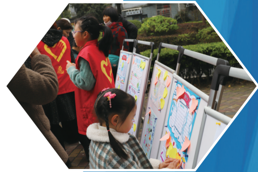
进社区开展节水宣传

批雨水收集利用示范项目。2020年水资源管理年报统计,全区实际用水量3.684亿立方米,万元国内生产总值用水量44.30立方米,较2015年下降23.33%。万元工业增加值用水量9.85立方米,较2015年下降18.19%。“十三五”期间,创成节水型载体96个,其中节水型机关单位60个、节水型企业3个、节水型社区6个、省市级节水型学校19个、节水灌区1个、市级水效领跑者2个,中盐常化获“市级水效领跑者”称号。2018年我区创成水生态文明城市建设试点,2020年国家节水型社会达标县通过省级验收。