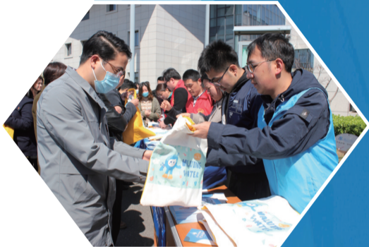
走进广场开展节水宣传