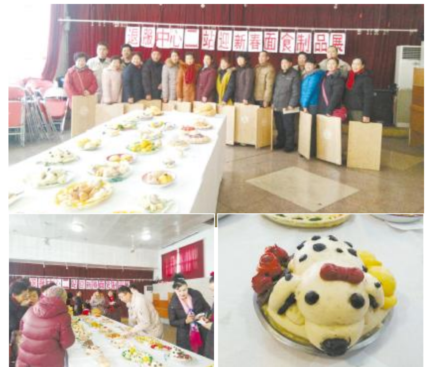
日前,八钢退服中心二站举办新春面食比赛,共展出了近百款式样的面点,评出10件优秀作品。“原来馍馍做多做少看家里情况,顾不上做图案,造型,现在条件好了,我按自己的喜好在馍馍上做图案,这个图案是用筷子画的,那个圆的造型是用花卷叠出来的。我还会用香豆、胡麻、姜黄等植物点缀颜色。”一位获奖的老同志说。这里有技艺的交流、味蕾的享受,展现了面食文化和技艺的传承,增进了退休职工之间的感情。

故乡元宵夜出灯虽不如大都市里那样火树银花不夜天,宝马雕车香满路,但亦错落有致、疏密成趣、静中有闹、令人心驰神往,流连忘返。我深深怀念故乡元宵节的土制灯笼,怀念提着灯笼去“走三桥”那趣味盎然的岁月。