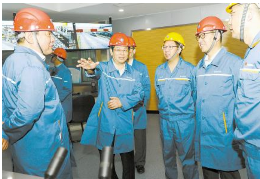
行业落实企业主体责任,切实遏制事故发生。同时,举一反三,加快推进重点企业、重点行业、重点领域构建风险分级管控和隐患排查治理双重预防机制,着力推进安

本报讯 6月6日至7日,全国冶金有色行业安全监管工作现场会在中国宝武举行,会议要求认真贯彻落实党中央、国务院关于安全生产工作重要决策部署,进一步强化责任措施落实,坚决防范遏制重特大事故发生,确保安全生产形势持续稳定好转。国家应急管理部党组成员、副部长孙华山,上海市副市长时光辉等领导,有关中央企业分管安全生产负责人、部分冶金(铁合金)、有色骨干企业负责人等出席会议。 会上,时光辉代表上海市政府致辞,孙华山作重要讲话。应急管理部剖析了近期典型事故案例,解读了相关文件,讲解了钢铁企业重大生产安全事故隐患排查标准。与会代表还参观了宝钢股份生产现场。 时光辉在致辞时表示,上海市将认真贯彻落实现场会的精神,进一步落实属地责任,切实加强安全监管,督促冶金有色