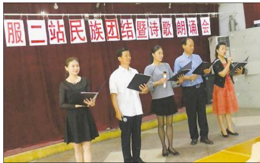
日前,八钢退服中心二站举办了“民族团结一家亲”诗歌朗诵会。经过一个多月的精心准备,共有38位退休职工参加。在近两个小时活动中,朗诵者们激情洋溢、声情并茂,演绎了《民族团结之花永远绽放》、《我眼中的八钢》、《建设者的足迹》等作品,讴歌了浓浓的民族团结情谊和祖国大家庭的温暖。