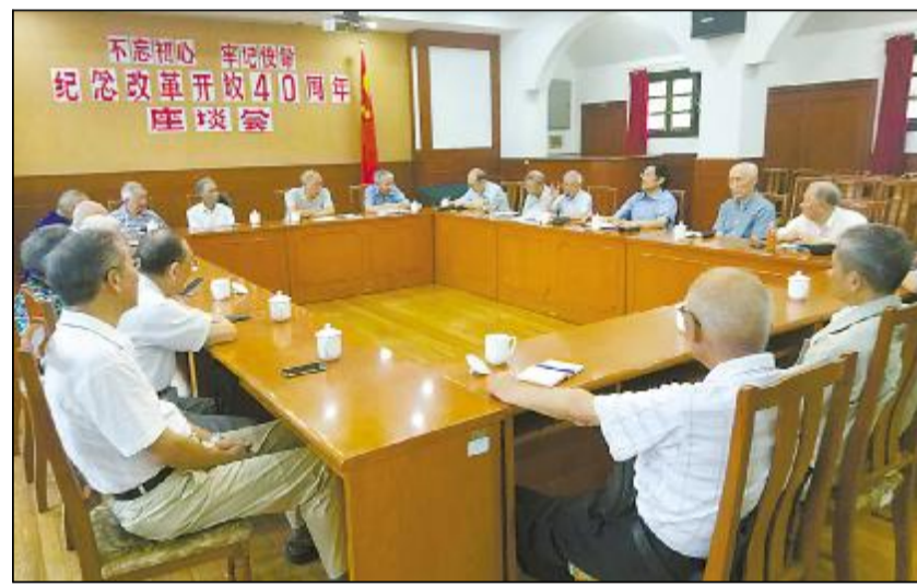
在建党97周年前夕,宝钢老干部二处组织离退休干部党支部书记召开“不忘初心,牢记使命——纪念改革开放40周年”座谈会。座谈会上,老同志们回忆“我走过的改革之路”,畅谈“不忘革命初心,永葆政治本色”的思想情怀。会上老同志发放了《习近平新时代中国特色社会主义思想三十讲》一书。