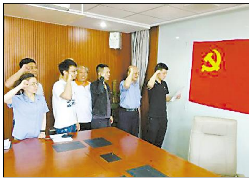
在纪念建党97周年之际,宝钢关工委教组老同志与宝钢新型建材科技有限公司青年老少结对,共话党的光辉历程。大家共同面对党旗,举起右手宣誓,面对未来,面对挑战,不忘初心,继续前进,创造新业绩。

除了采取声光电等现代手段介绍外,还有大量实物展品、大量图片资料以及影像资料等,展览不仅涉及钢铁工业方面的情况,还有张之洞的思想,以及当时经济、工商业、教育业等方面发展情况。展览内容可谓博大精深,展示的物品翔实多样,展现的方法新颖独特,老同志们说很有启示,很有收益,不虚此行。