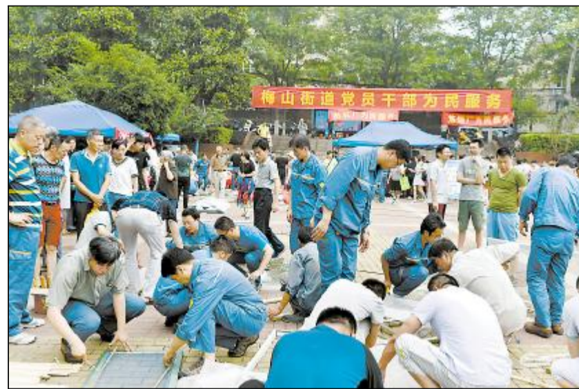
日前,梅钢公司组织部分党员走上街头为社区居民提供各类便民服务,纪念建党97周年,受到居民欢迎。