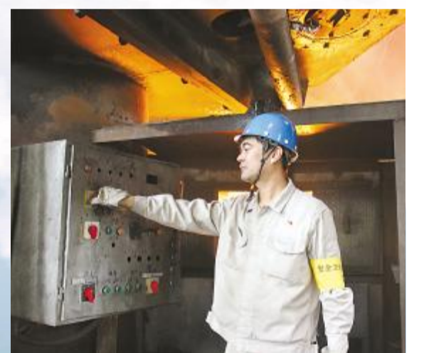
背后是火红的铁水，所站之处是高温液态金属区域，对于韶钢员工而言，不论春夏秋冬，这里的闷热如出一辙。