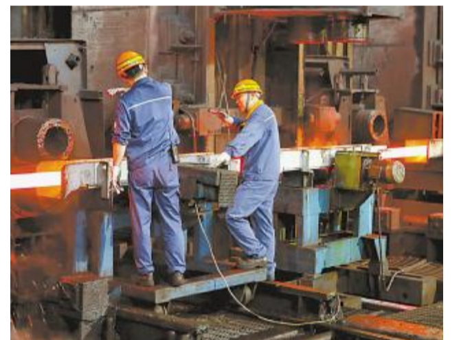
宝特长材棒材一厂轧机调整工在轧线上检查热态棒材表面质量，滚滚热浪扑面而来，工作服湿了又干、干了又湿。