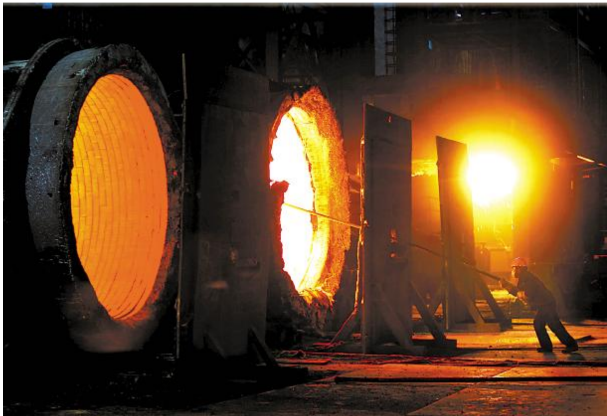
八钢炼铁厂员工正在进行钢水修包作业，烟热的操作并没有受到气温的影响。在这里，“战高温”是常态。