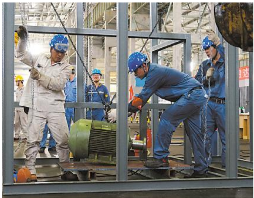
东海岛的夏天无比炎热，宝钢股份东山基地设备部牵头给设备“开个灶”。