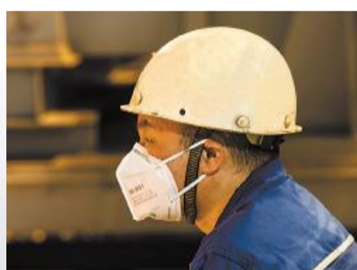
宝钢股份镀锌板厂二次冷轧调试现场，虽然厂房内闷热难当，但宝信软件电气工程师依然争分夺秒完成电气柜接线任务。