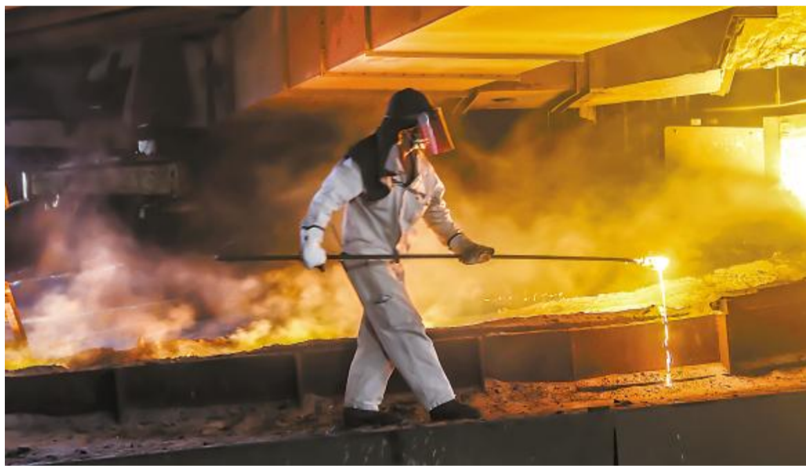
宝钢德盛第二粗炼厂矿热炉旁的环境温度高达50-60摄氏度，炉前工将安全帽、护目镜、口罩、手套穿戴严实，不畏烈焰的“烤”验，手拿钢钎测温取样。