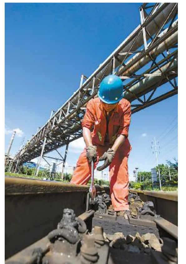
为防止高温造成铁路线路胀轨和断轨，每天早上六点半，宝钢股份梅山基地运输部工电设备作业区员工都要在烈日下“走一圈”，一走就是三个多小时。