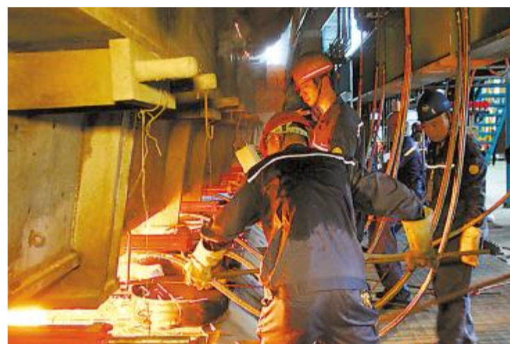
火红钢水映红了鄂城钢铁炼钢工人人们的脸庞。大家的工作服“干湿参半”，汗水顺着发梢不停地滴答着，却没有人顾得上将汗水拭去。赵劲松 摄