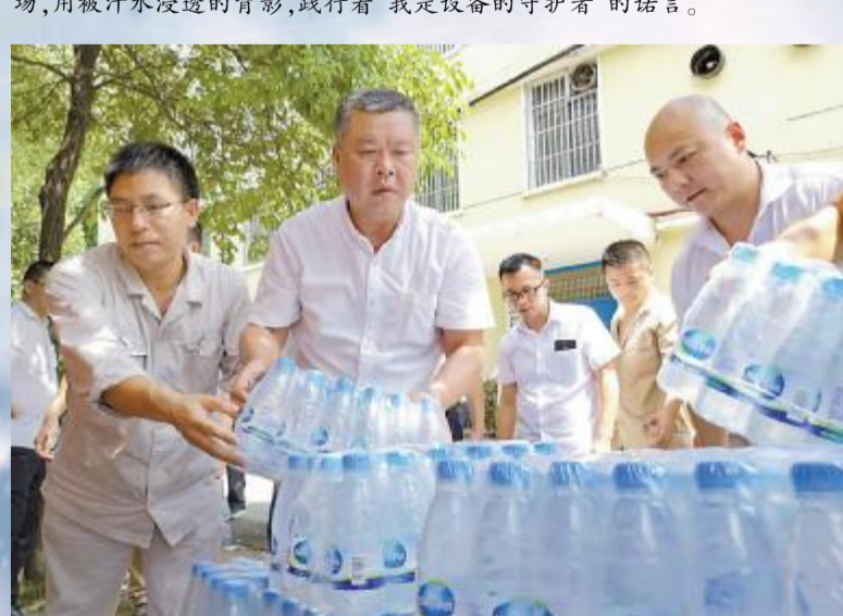
武汉长江现代物业有限公司为驻扎在宝钢股份武钢有限产服务点的职工送去了清凉。