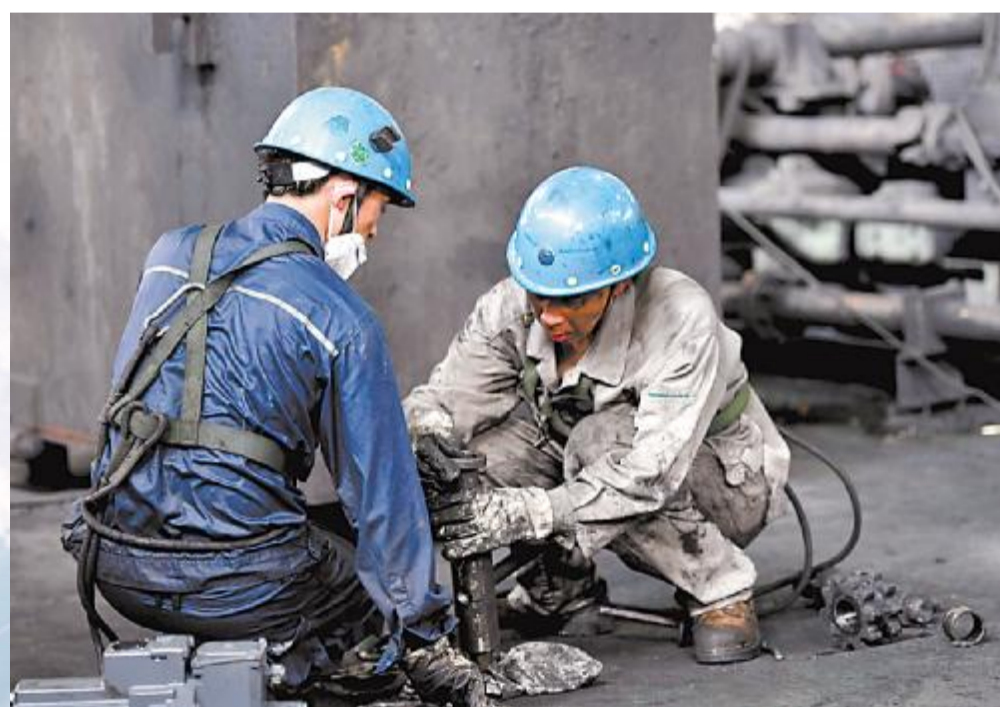
宝钢工程宝钢技术检修事业部员工在宝钢股份钢管条钢事业部停机6小时换辊检修作业现场，用被汗水浸透的背影，践行着“我是设备的守护者”的诺言。