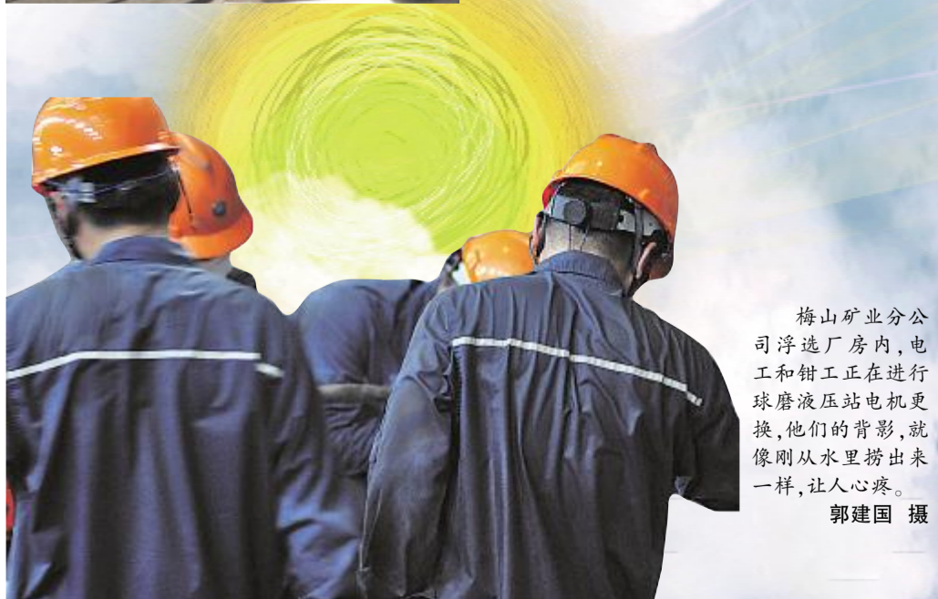
梅山矿业分公司浮选厂房内，电工和钳工正在进行球磨液压站电机更换，他们的背影，就像刚从水里捞出来一样，让人心疼。