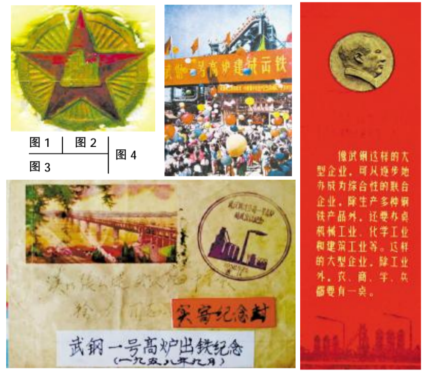
图1 图2 图3 图4

以上4件藏品，真实地记录了武钢发展史上最重要的一刻，值得我们回顾。我们相信，在宝武重组为世界第二大钢铁集团的背景下，作为中国宝武重要骨干力量的武钢集团和武钢有限，一定会有光辉灿烂的明天。