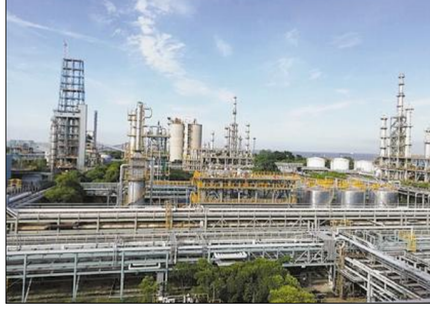
日前,由中冶宝钢第三分公司承接的宝武炭材煤精三、四硫酸装置新增尾气除雾器项目完工。项目改造完成后,可有效降低除雾器的负荷,稳定尾气中酸雾的含量,消除环保隐患,节约能源,提高除尘效率。

武钢残联对于此次精心策划组织的活动进一步唤起广大残疾职工的健身热情,鼓励他们走出家门,参与体育活动,为他们更好地融入社会创造条件。