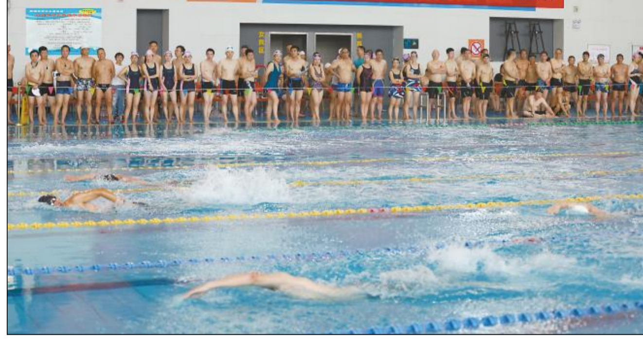
8 月 11 日,宝钢股份武钢有限第三届职工游泳比赛举行。本次游泳比赛集竞技性和趣味性于一体,共设男子组 50 米蛙泳、男子组 50 米自由泳、男子组 100 米蛙泳、男子组 100 米自由泳、女子组 50 米、男女子组 200 米及 4X50 米接力、团队过河、勇往直前等 9 个项目。来自各基层单位 18 支代表队的 200 余名运动员参加了角逐。

新资产。讲坛来自宝信软件研发部、信息服务事业本部及信息化事业本部的六位数字大咖共同演绎,以“仰望大数据星空,描绘数字化云图”为主题,以“存 Store、成 Succeed、智 Smart、现 Show”的 4S 产品套件为核心,集中展现了对大数据之路的思考和探索。