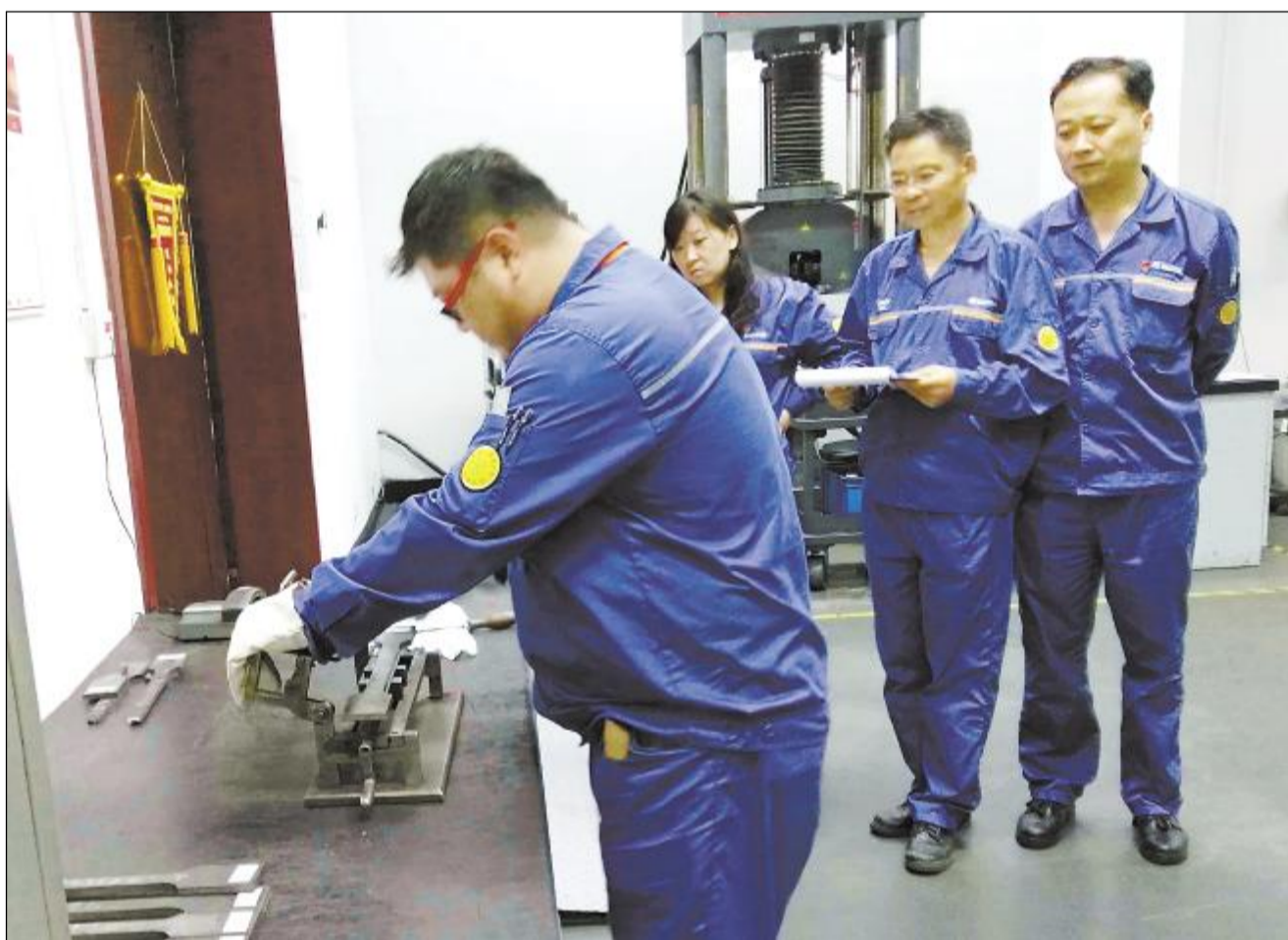
近日,宝钢股份宝山基地制造管理部为营造员工钻研业务、学技术的工作氛围,全面提升检验技术水平,组织开展了物理检测工技能操作比赛,共有 111 名员工踊跃参加。此次比赛对多技能工种的培养和提升服务质量打下了坚实基础。