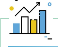
智慧制造“四个一律”(4A)指数综合评价

大力推进绿色发展智慧制造,全面对标找差,创建世界一流。从今日起,本版将定期刊登各钢铁基地的智慧制造“四个一律”指数、绿色发展指数,推动绿色发展和智慧制造工作再上新台阶。