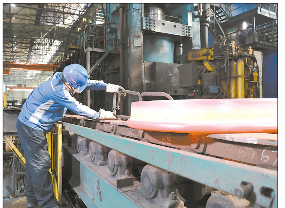
面对严峻的新冠肺炎疫情阻击战，马钢交材公司坚持停工不停产，在指导员工加强自我防护的同时，积极做好工作区域和各类量具、设备的病毒消杀工作，确保防疫、生产两不误。图为2月18日上午，热轧分厂热检员对线上的车轮进行尺寸测量。

据悉，2月6日-8日，武钢物流每天组织13台翻斗车投入江夏废钢料场运输，每台车每天运送2趟，共安全运送废钢近2000吨，确保了武钢有限废钢运输不断线、生产不停顿。