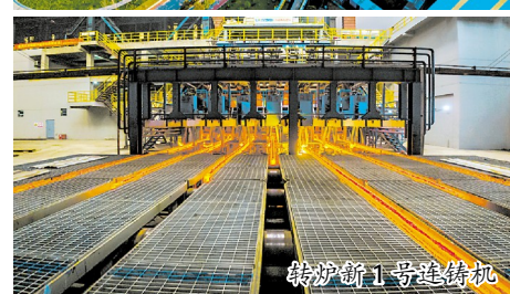
炼炉炉工号连铸机