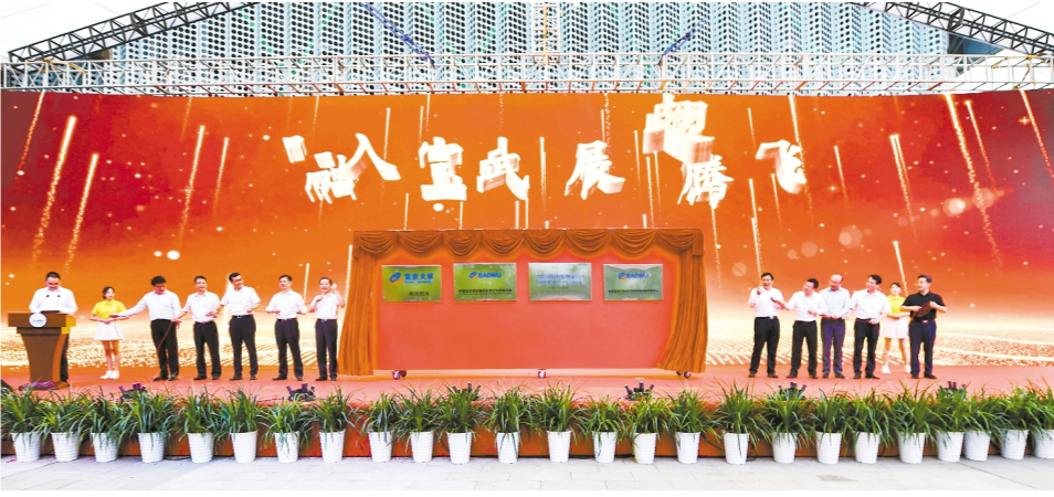
▲领导为中国宝武西南总部、中国钢铁博物馆(筹)、宝武大学重庆校区及中国宝武中央研究院西南新材料研发中心等揭牌