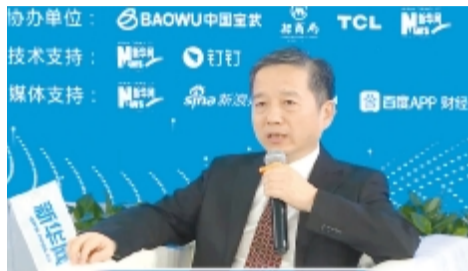
■记者 李忠宝 报道