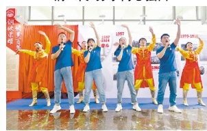
演唱歌曲《我的未来不是梦》