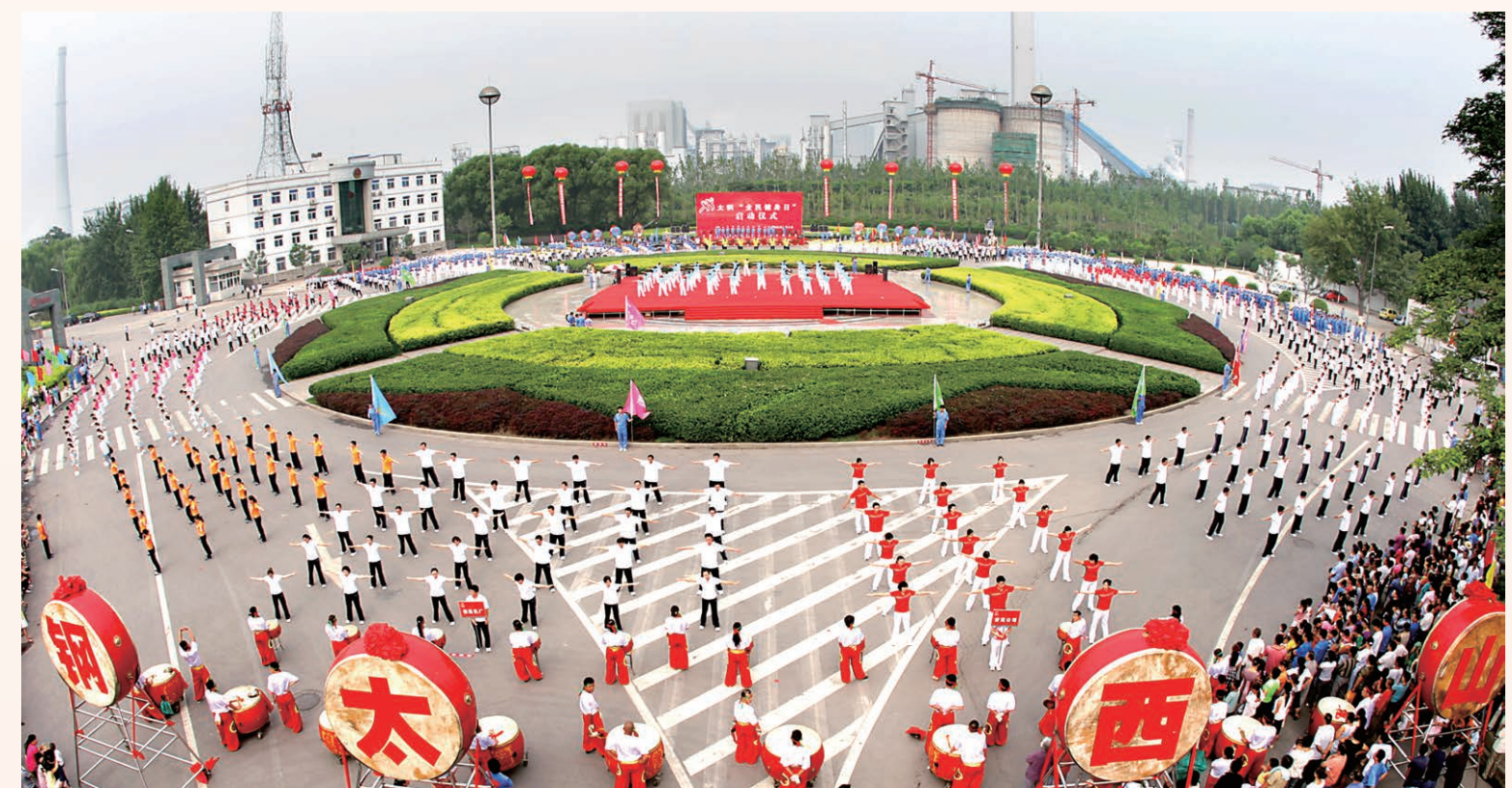
▲新时代全民健身动起来,太钢举行“全民健身日”系列活动

太钢将坚持以习近平新时代中国特色社会主义思想为指引,自觉践行新发展理念,坚守自主创新、产业报国初心,牢记大国重器使命,再接再厉,勇攀高峰,为建设世界级不锈钢旗舰不懈奋斗。