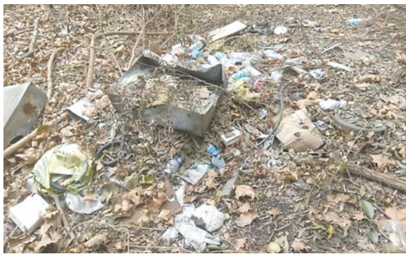
宝山纬一路,“宝钢铸造公司”指示牌附近绿化带里垃圾成堆。