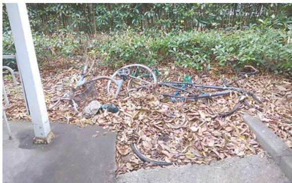
宝山机四路上,自行车棚边绿化带里长期放置废弃自行车。

人人都是“啄木鸟”,基础管理靠大家!自“找差大家‘看’”栏目开设以来,员工们像一只只勤奋的“宝武啄木鸟”,发现身边的短板和不足,第一时间用手机拍照投稿,当起监督员、挑剔员,督促及时整改问题。企业是我们自己的家,我们要善于发现美好、点赞优秀,也要有敢于揭短亮丑、知耻而改的勇气,变企业管理“一家管”为“大家管”,让共管、共建、共享真正在中国宝武落地开花!