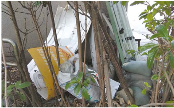
宝山硅钢一路附近(门卫间后面)堆放多种垃圾。