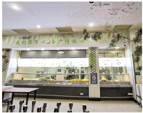
宝钢股份热轧食堂里写着“客户请放心”，但发霉、斑斑的环境，能否让就餐员工放心呢？