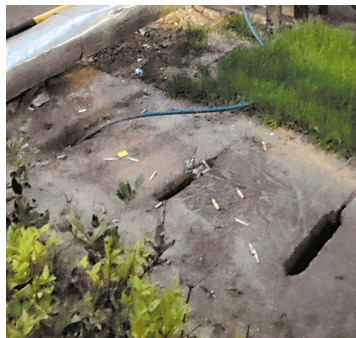
马钢交材安徽省智能工厂(车轮公司二分厂)北面，轮箍东路天门大道57号路段区域，检测中心抛丸机(员工入口)旁边垃圾多。