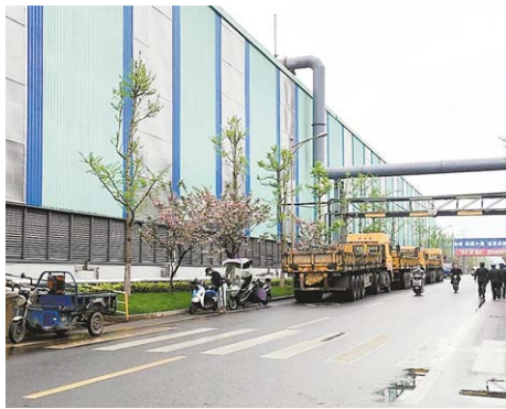
马钢交材安徽省智能工厂(车轮公司二分厂)，轮箍东路天门大道57号轧钢门口停车乱，没有规划。

短评 私家车“霸道”超车、作业车辆乱停、车门外垃圾满地、食堂天花板上“爬”满霉斑……这是员工近日在太钢集团、马钢交材、宝钢股份热轧食堂拍到的情况。“霸道”超车、乱停车的行为，不仅影响道路通行秩序，还妨碍了非机动车正常行驶，威胁非机动车驾驶人安全，且“霸道”车经常出现在下班高峰时段，构成安全隐患。食堂天花板上霉点斑斑，在这种“倒胃口”的环境就餐，员工怎么放心、舒心？车门外随处可见的垃圾，对厂区环境造成严重破坏，且车间接吸烟隐患大，乱扔烟头易成灾。这种情况的出现一方面是员工行为习惯、安全意识的不到位，另一方面也是因为“那条路连个垃圾箱都没有”。