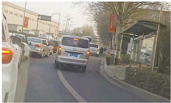
太钢五高炉西面的马路上，机动车不排队，利用非机动车道超车。