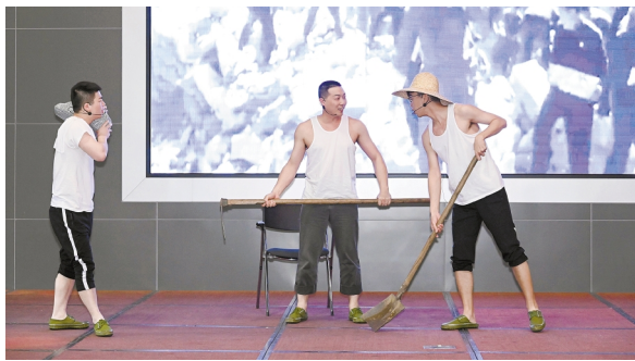
制作的职工歌咏视频,并为党史学习教育“最赞支部”颁奖。中南钢铁党委领导指出,举办“党史故事宣讲大赛”,对于深入学习

来自重庆钢铁、韶钢松山、鄂城钢铁,以及中国宝武韶关区域子公司代表华欣环保等基地党员代表,分享了7个红色故事。经评比,《逆行中的铁血柔情》获得一等奖,《红色追寻悟初心》《钢铁血脉工农渠》获得二等奖,其余4个故事获得三等奖。会上展播了中南钢铁各基地