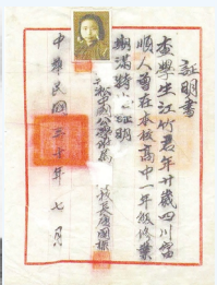
江竹筠慕江铁矿入会证明文书