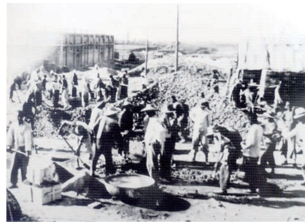
▲1934年8月8日，太钢的前身——西北炼钢厂正式破土动工。