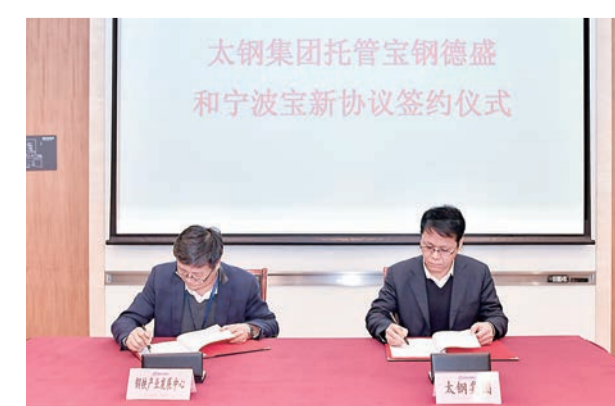
◀2020年12月30日，太钢集团托管宝武德盛和宁波宝新协议签约仪式在宝武大厦举行，进一步推进不锈钢产业的整合融合工作。