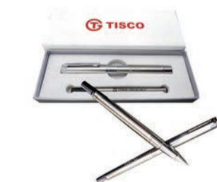
▲2016年9月，太钢历经五年自主研发，成功生产出笔尖钢，破解了李克强总理提出的“笔尖难题”，改变了我国制笔行业材料长期依赖进口的局面。