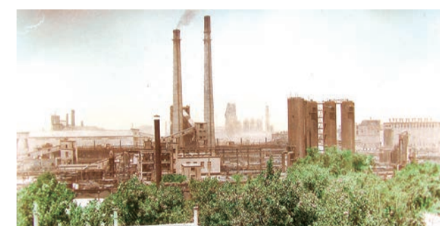
▲1979年，太钢年产量突破100万吨，跨入百万吨大钢厂行列。