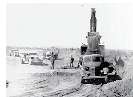
▶1957年8月19日，太钢扩建的第一个工程——1000毫米冷轧机工程破土动工。