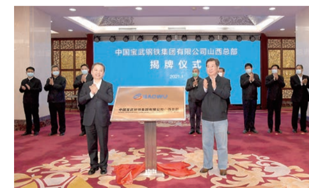
◀2021年1月15日，中国宝武钢铁集团有限公司山西总部揭牌。这是中国宝武和山西省深入贯彻落实习近平总书记考察调研中国宝武和视察山西重要讲话重要指示精神，加快实施战略合作，打造中国宝武不锈钢专业化平台公司，推进中国宝武不锈钢产业的整体规划和一体化运营之后的又一重大举措。

钢铁行业老将，开疆拓土新兵 牢记嘱托、不辱使命，同心同向同奋力 攻坚克难、追求卓越，共建共创共前行 传承红色基因，抢抓发展机遇 全面融入宝武高质量钢铁生态圈 矢志共同打造全球钢铁业引领者