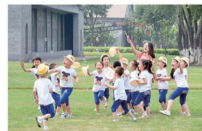
▲2001年，太钢开展“公众开放日”活动，先后有10多万名普通市民及社会公众走进太钢，目睹绿色发展成果，感受现代工业文明。