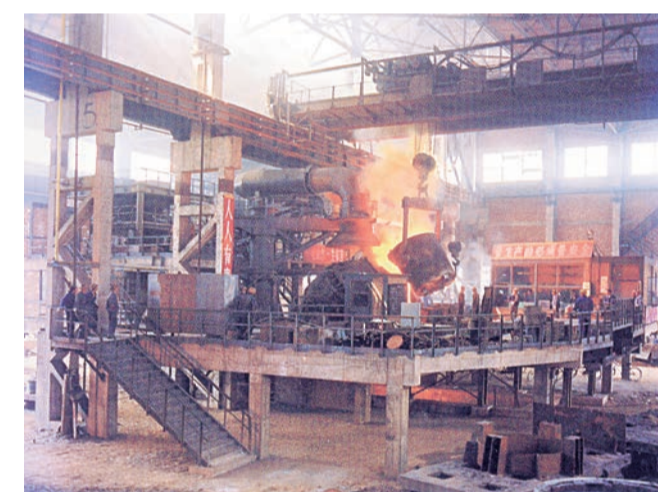
▲1983年9月，我国自行设计、制造和安装的第一台18吨氩氧炉外精炼炉在太钢建成，冶炼出我国第一炉超低碳不锈钢。

党的十一届三中全会后，太钢解放思想、整顿企业管理、推进企业改革、转换经营机制、加速技术改造，企业活力日益增强，向着建设大型钢铁联合企业迈出新的步伐。