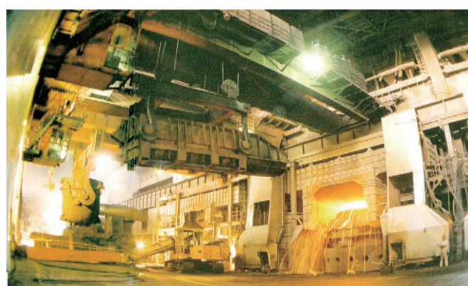
▶2000年至2003年，太钢实施50万吨不锈钢系统改造工程。该项目的建成投产，标志着太钢形成了年产100万吨不锈钢的能力，进入世界不锈钢十强行列。

面对激烈的国际竞争，太钢实施不锈钢系统改造和新不锈钢工程及配套项目建设，深化内部改革和流程再造，推进信息化、精细化管理，实施节能减排项目，企业面貌发生深刻变化，综合竞争力迅速提升。