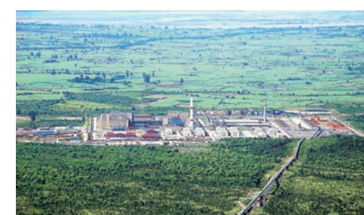
▲2013年3月，太钢与中国有色集团共同建设的缅甸达贡山铁矿项目全面投产，形成年产产镍铁8.5万吨的能力。