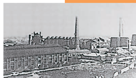
▲1937年9月，西北炼钢厂基本建成。