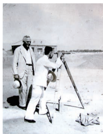
▲1932年6月，西北实业公司成立炼钢筹备委员会，从太原、阳泉抽调留美留欧、日本的冶金专家和技术人员，着手筹建炼钢厂的各项准备工作。

太钢的前身是西北实业公司西北炼钢厂。从筹建到新中国成立之前，西北炼钢厂饱经坎坷和磨难，设备常年失修，工厂处于半停产状态，解放前年产量最高仅1.6万吨，始终未能达到生产设计能力。