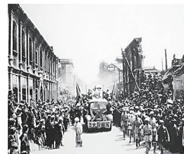
▲1949年4月20日，西北炼钢厂解放，回到人民手中。同年5月20日，西北炼钢厂1号平炉出钢，全面恢复生产。1949年8月，西北炼钢厂改组为西北钢铁公司。1950年4月，西北钢铁公司更名为太原钢铁厂。

太原的解放和新中国的成立，开启了太钢历史新纪元。回到人民怀抱的西北炼钢厂迅速恢复生产，在党的领导下，焕发勃勃生机。太钢被定位为特殊钢生产厂，开始大规模扩建和改造。