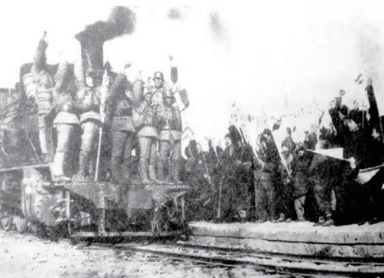
▲1937年7月7日，卢沟桥事变爆发。7月20日，西北炼钢厂建立中共地下党第一个支部，积极开展发展党员，开展救亡运动。9月，西北炼钢厂工人参加工人武装自卫旅，开赴抗日前线。