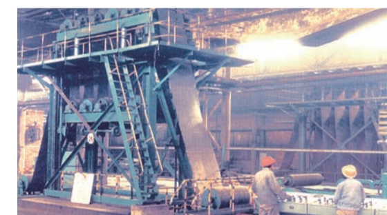
◀上世纪90年代，太钢进行了以1350立方米高炉、尖山铁矿和1549毫米热连轧工程为主体的系列技改和建设项目，钢产量突破200万吨，向大型特殊钢铁联合企业迈出了新的步伐。