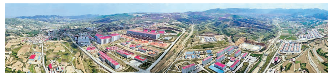
▲2012年7月，太钢与国内相关科研院所合作，突破我国长期以来细粒赤铁矿选矿技术难关，建成亚洲规模最大、工艺装备最先进的吕梁岚县铁矿选矿厂。

党的十八大以来，太钢坚持创新驱动发展战略，以技术创新为支撑，加快研发生产独有、首创、首发和领先的高端与特色产品，建设以不锈钢为主的极具竞争力的高端特色精品基地，为国民经济重点行业和关键领域转型升级作出了重要贡献。