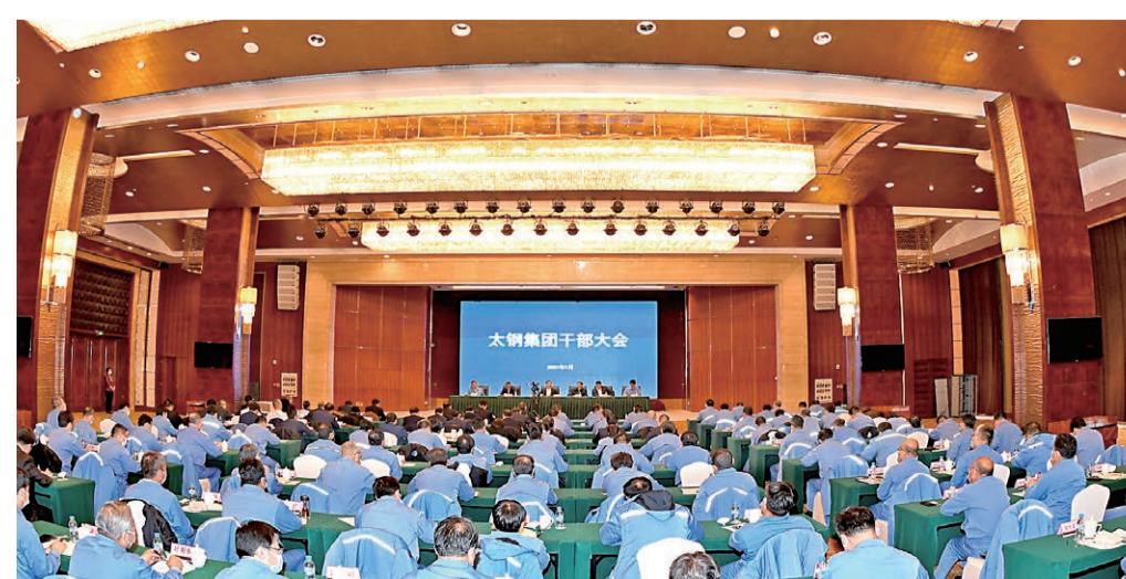
▲2021年1月5日，太钢集团举行干部大会，强调要牢记钢铁报国初心，加快推进太钢集团的管对接、整合融合工作，加快不锈钢全产业链体系建设，加速实现全球不锈钢业引领者的目标。

2020年12月23日，太钢正式成为中国宝武大家庭的一员。太钢迎来了新的发展机遇，掀开了历史发展的新篇章。