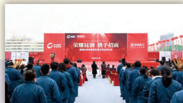
昆钢与招商局口本部转型项目首开区启动

开放是企业跨越式发展的必由之路。多年来，昆钢坚持以“在开放中发展、在合作中共赢”的姿态，在云南率先引入武钢、华润等央企对资产进行重组，与中国招商局集团、中铁建设集团等开展深度合作，有力促进了转型升级步伐，对未来的发展之路奠定了坚实基础，尤其在2007年，昆钢股份与武钢的合作，大力提升了昆钢钢铁装备水平和生产能力，也更加坚定了昆钢走开放发展之路的信心。2021年2月1日，昆钢踏上“亿吨钢铁航母”，开启了奋进新时代的新征程。