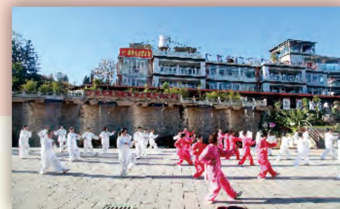
社区老人在昆钢养生敬老中心健身