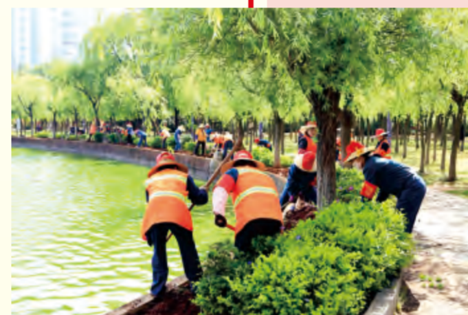
职工参与创建“全国文明城市”建设