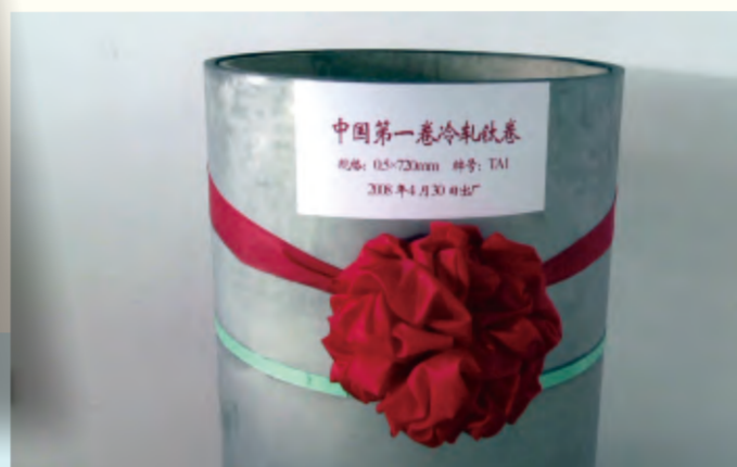
中国第一卷冷轧铁卷