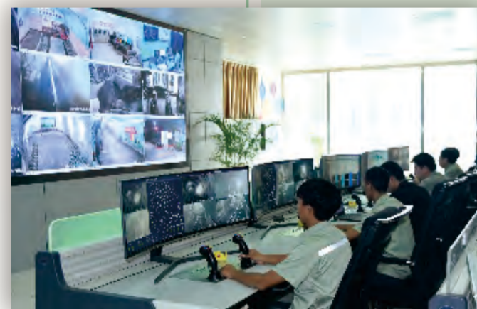
大红山矿业公司井下电机车远程驾驶