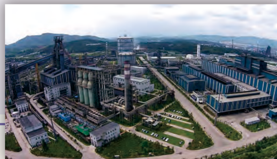
昆钢与武钢合作后建成的安宁草铺钢铁生产基地一期项目