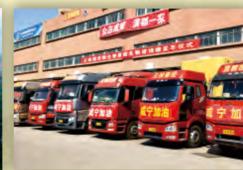
昆钢公司抗疫物资驰援湖北咸宁