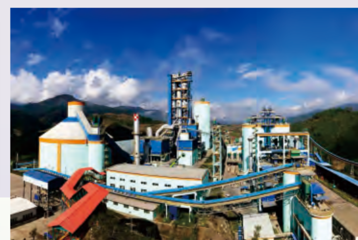
普洱昆钢嘉华水泥厂