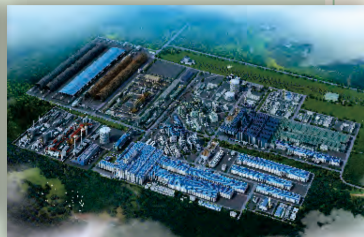
安宁草铺钢铁生产基地