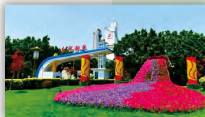
红河钢铁生产基地

绿色是新时代发展的底色，践行绿色低碳可持续发展是新时代钢铁企业的使命。作为昆钢钢铁生产的“大粮仓”，长期以来，昆钢大红山矿业公司坚持以建设“绿色、深地、智能化”为宗旨，以“矿区环境生态化、开采方式科学化、资源利用高效化、管理信息数字化、矿区社区和谐化”为抓手，有力推进探矿增储、资源综合利用、固废资源化处置、生产工艺优化升级、土地复垦等工作，全方位保持矿山流水潺潺、绿树成荫的本色，确保井下职工的安全舒适。2021年，大红山矿业公司荣获首届“全国绿色高质量发展二十佳矿山”。当前，昆钢正深入推进本部环保搬迁转型升级项目，通过高水平产能替代，采用国内一流的环保、节能、节水、资源综合利用技术，在草铺新区打造钢铁智能制造示范基地，实现钢铁绿色低碳转型，推进“美丽云南”建设。