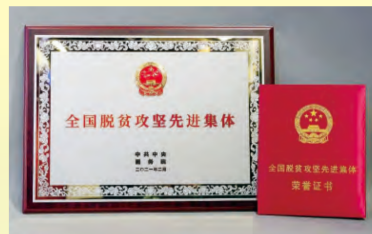
昆明金福公司荣获全国脱贫攻坚先进集体

82年来，作为云南省工业战线的排头兵，昆钢始终与云南经济社会发展同频共振，共享发展成果。2015年，昆钢投身“万企帮万村”的火热实践，肩负起挂钩帮扶宣威市海岱镇月亮田村和腊谷村的重任。五年来，通过产业、教育、消费、生态、就业等精准扶贫措施，与挂钩帮扶的乡镇通力合作，投入资金超过5800万元，带领1400多个建档立卡贫困户、5300多名贫困人口打赢脱贫攻坚战，实现了户脱贫、村出列、县摘帽的目标。2021年2月，以“海岱金果”为核心帮扶产业的昆明金福公司荣获中共中央国务院颁发的“全国脱贫攻坚先进集体”奖牌和荣誉证书。贯彻习近平总书记“接续推进全面脱贫与乡村振兴有效衔接”的安排部署，昆钢已经在建设美丽乡村的路上再接再厉，贡献钢铁力量。