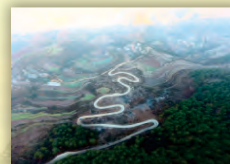
昆钢援建的宣威海岱镇扶贫路之一