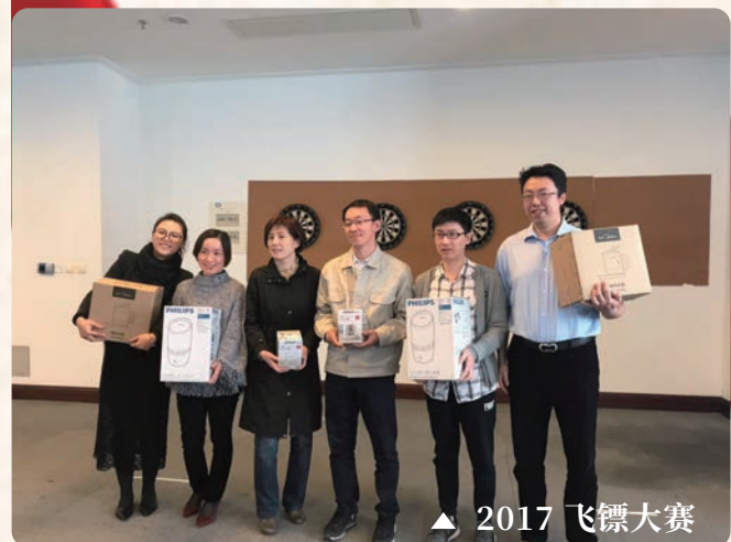
▲ 2017 飞镖大赛