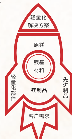
▲“一体两翼”战略模型

入职江北冷弯型钢八年多，我已经从刚出学校时的“极端口控”成长为具备大局意识的“技术控”。只要我们每个职工在工作中锁定