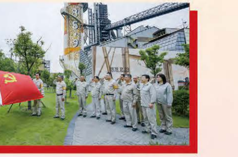
宝钢建材组织党员参观宝山基地一高炉大修纪念馆