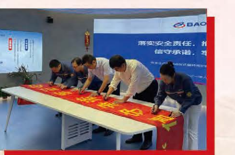
转底炉事业部组织签订党员安全承诺