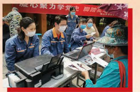
金资公司党员下沉服务队为社区居民办实事