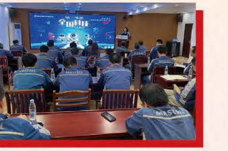
环科马鞍山将“党史教育”融入“科技工作者日”系列活动中