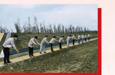
宝发环科开展“许美好愿望，献绿色爱心”播撒草籽活动，美化环境