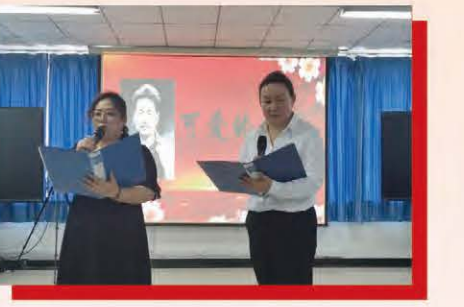
互力佳源开展“民族团结一家亲 我与对子学党史”读书活动