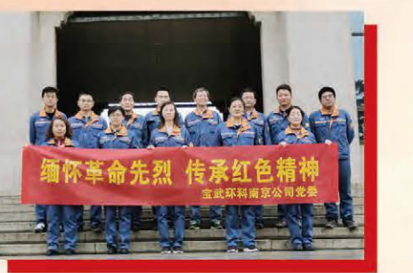
环科南京组织党员瞻仰英烈，坚定员工信仰