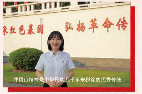
华欣环保青年党员讲述红色故事