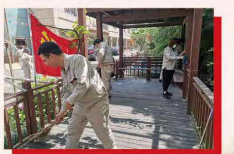
工业环境部党员为养老院提供志愿服务