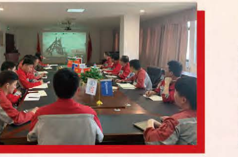
温州环发组织员工观看《百年宝武》