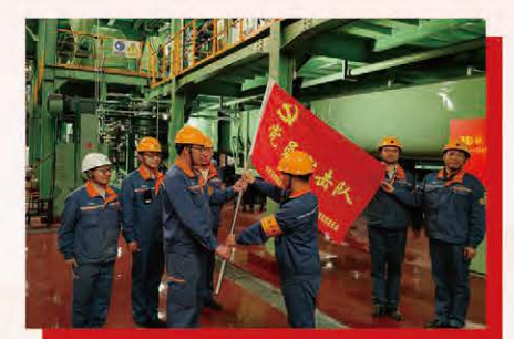
宝钢矿业党员突击队亮身份、兑承诺