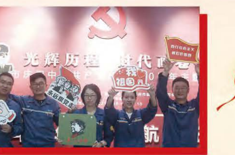
环科鄂州公司组织党员参观“奋斗百年路 启航新征程”主题展