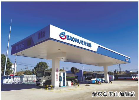
武汉白玉山加氢站