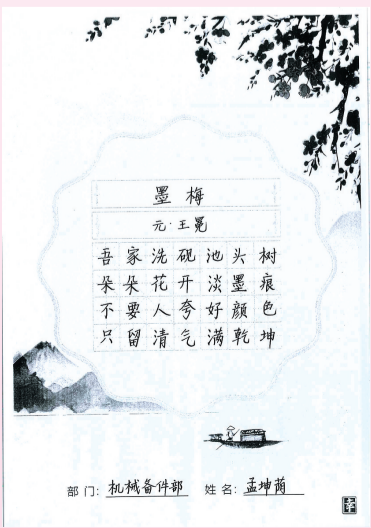
▲书法（欧冶工业品：孟坤萌）

为发挥红色文化铸魂育人的功能，进一步推进党建工作与生产经营深度融合，更好结合模拟经营和产品变革的新要求，日前，宝钢股份武钢有限炼钢厂党委组织全体党员来到任弼时纪念馆和杨开慧纪念馆，接受红色文化的熏陶，深入了解党的光辉历程和革命精神，汲取革命先辈的智慧和力量。 承先辈担当，创一流业绩。步入任弼时纪念馆，大家被任弼时同志一生为了党和人民的事业，不辞重负奋力前行的“骆驼精神”深深震撼。他“一怕工作少，二怕麻烦人，三怕多花钱”的三怕精神和“能坚持走一百步，就不走九十九步”的坚毅品质让党员们深受感染。党员们表示要学习任弼时同志的忠诚奉献、任劳任怨的骆驼精神，进一步坚定理想信念，发挥“党员五在前”作用；工作中，要将学习到的精神化作炼钢人对高品质钢材的执着追求，让改革在基层见成效，使红色精神在钢流奔腾中绽放出新的光彩。 学烈士坚贞，做攻坚先锋。杨开慧同志在革命艰难时期，始终坚定地支持毛泽东的革命事业，面对敌人的威胁和迫害毫不畏惧，最终为了革命理想英勇就义。她的精神是宝贵的精神财富，具有强大的感染力和号召力。党员们表示面对困难时要更加坚定信心，勇于挑战，解决生产中的难题，为国家的工业建设和经济建设作出更大贡献。 此次学习教育活动，给炼钢厂的党员们带来了一次深刻的思想洗礼。全体党员干部将以先辈精神为指引，坚定发展信念，以优良的作风带领全体员工立足岗位，同心同向、攻坚克难，全面落实2025年“六·八·十”工作举措，为推动炼钢厂转型升级、高质量发展而努力奋斗。 （潘强 陈鹏 三美）