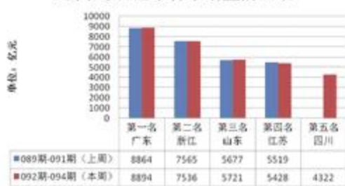
近两周双色球省市销量前五名

球总销量为9.57亿元，较去年同比增长4%。其中第17092期销量为3.08亿元，第17093期销量为3.08亿元，第17094期销量为3.41亿元。2016年同期周销量为9.21亿元，其中第16092期销量