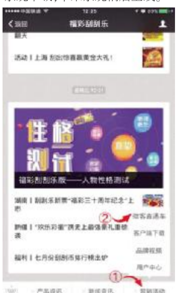
“福彩刮刮乐”微信号活动入口