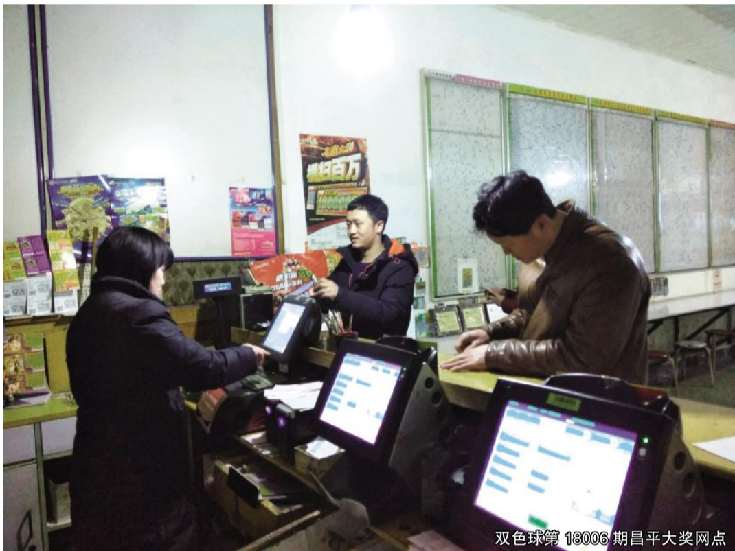
双色球第18006期昌平大奖网点

1月21日,双色球第18009期开奖,一等奖单注奖金547万元,二等奖奖金只有45908元。北京地区头奖中出5注,均来自东城区北京火车站马家湾胡同16号福彩销售网点,值得注意的是