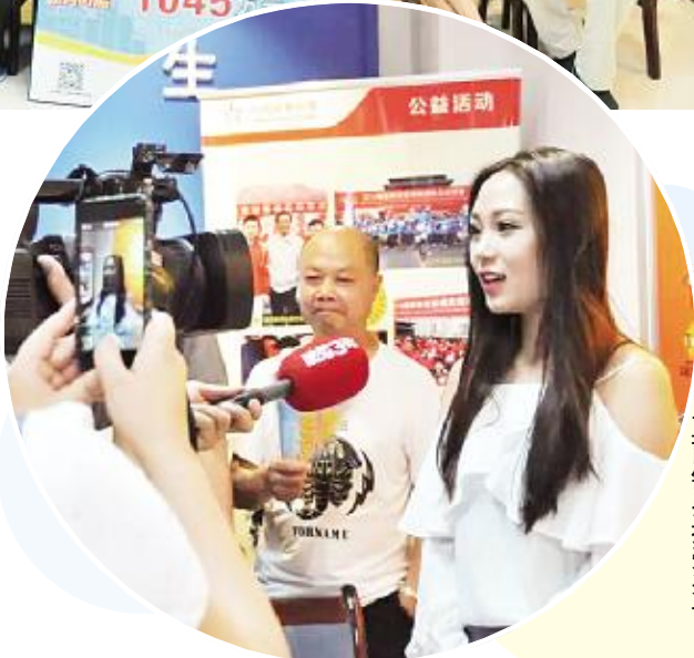
直面镜头接受采访

次日一早,25位彩民代表来到陕西省体彩中心领奖,中奖者在合影时全部露脸,并且接受了媒体采访。