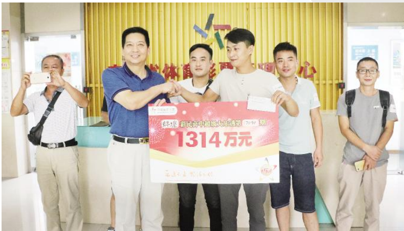
部分合买团成员领奖

今年以来,合买中得体彩大奖的彩民越来越多,领奖时露脸的中奖者也越来越多。这些大奖得主多为合买中奖,少则三五人,多则近百人,大家组团领奖,直面镜头,分享中奖喜悦,欢乐多多。露脸领奖,也从另一个侧面证实了大奖的真实性,起到了提升体彩公信力的作用。就像河南136万元足彩大奖得主说的那样,作为体彩业主,以往他只能从开奖流程等方面向彩民解释体彩中奖是真实的,这次中奖让他有了“现身说法”的机会。(艾禾)