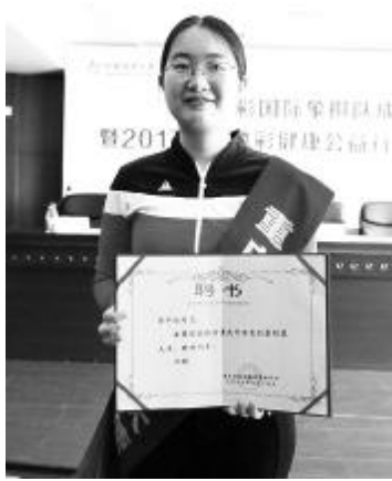
重庆体彩形象大使谭中怡