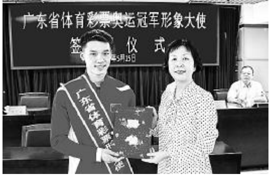
广东体彩形象大使陈艾森