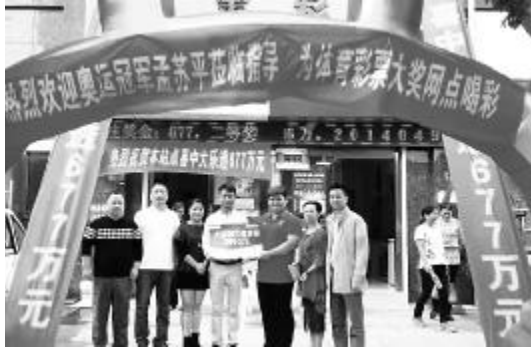
奥运冠军孟苏平(右三)参加大奖网点庆祝活动