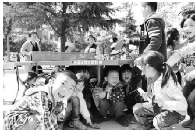
「公益体彩快乐操场」活动开展以来,已成为全国3200多所学校送去体育器材。

过去的五年,全国体彩系统大力弘扬“责任、诚信、团结、创新”的体彩精神,改革创新、勇于担当,体育彩票事业呈现出蓬勃发展的良好局面,销售规模实现快速增长。五年间,体育彩票累计发行销售7742.21亿元,环比增长4699.89亿元,为国家筹集公益金1955.81亿元。自1994年全国统一发行以来,中国体育彩票已经累计销售12326亿元,筹集公益金3341亿元,为社会公益事业和体育事业的发展作出了重要贡献。这些公益金一方面用于发展我国社会保障,资助社会福利及慈善机构、资助社会公益活动等公益事业,另一方面用于支持我国体育事业的发展。体育彩票公益金在实施“全民健身计划”和“奥运争光计划”,引导和推动体育产业发展中发挥了重要作用,有效地弥补了国家在体育事业特别是全民健身事业上的资金投入。