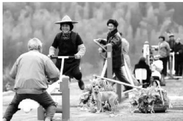
体彩健身路径遍布城乡

五年里,体育彩票公益金的使用一直向群众体育倾斜,用于群众体育的公益金逐年增加。以身边随处可见的全民健身路径为标志,体育彩票公益金已资助建成了体育健身工程、全民健身活动中心、体育公园、健身广场、户外营地、健身步道等多种设施类型,为群众提供了免费、方便、实用的健身活动器材和场所。过