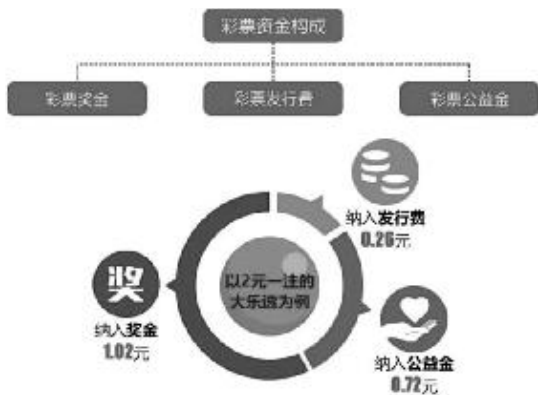
体彩彩票资金构成

比例为 20%, 也就是说, 彩民每花 10 元买 1 张顶呱刮彩票, 就有 2 元进入公益金。